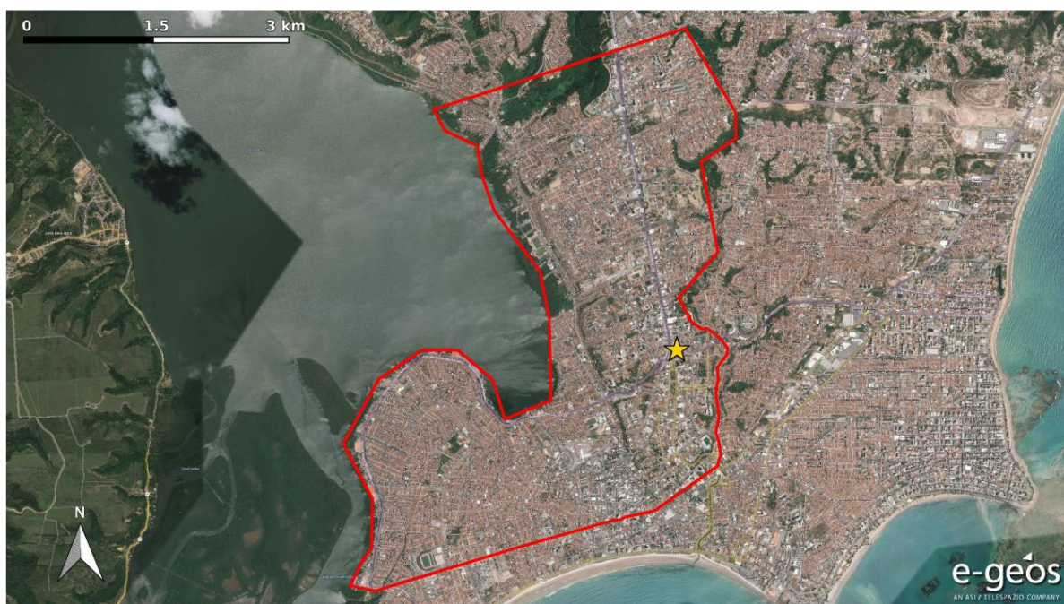
Figura 3 - A estrela amarela identifica a zona onde o ponto de referência foi selecionado para as medidas PSP-IFSAR em geometria ascendente.

Na verdade, o aumento do número de imagens permite usar limiares menores no critério de seleção dos PS e assim obter uma melhor capacidade de detecção mantendo-se estável a taxa de alarmes falsos. Por outro lado, reduzir o número de imagens requer o uso de limiares maiores, com uma piora na densidade e distribuição dos PS.