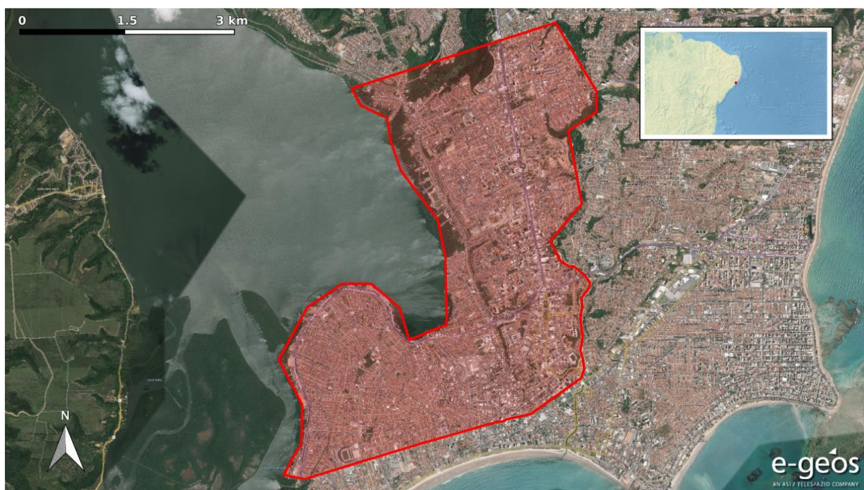
Figura 2 - Área de Interesse (AOI)

A área de interesse compreende uma porção da cidade de Maceió, como demonstra a Figura 2. Conforme explicado anteriormente, obviamente nenhum ponto de medição foi selecionado nas áreas de vegetação e água. Entretanto, a análise PSP dos produtos COSMO-SkyMed ascendentes permitiu extrair um grande número de PS. Em particular, onde as características radiométricas do alvo não mudaram muito no período analisado, muitos PS foram identificados e as correspondentes medidas de deformação no solo foram estimadas.